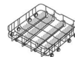
Półka na filiżanki