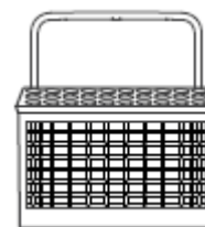
Kosz na sztućce